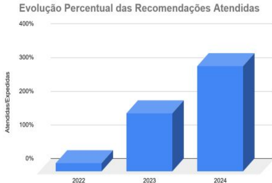
GRÁFICO: EVOLUÇÃO DAS RECOMENDAÇÕES ATENDIDAS