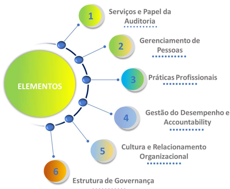
Figura 3 - Elementos Modelo IA-CM

Os quatro primeiros elementos – Serviços e Papel da Auditoria Interna, Gerenciamento de Pessoas, Práticas Profissionais, e Gerenciamento do Desempenho e Accountability – referem-se, principalmente, à gestão e práticas da atividade de auditoria interna em si. Os últimos dois elementos – Cultura e Relacionamento Organizacional e Estruturas de Governança – incluem a relação da atividade de auditoria interna com a organização e os ambientes internos e externos.